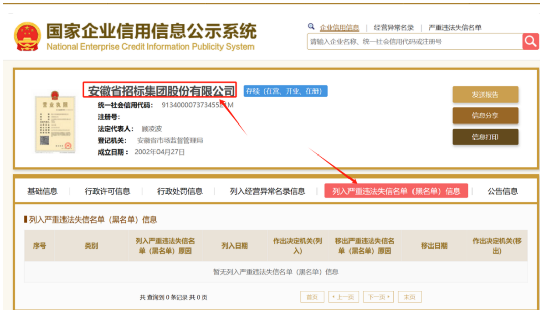
示例3: 严重违法失信名单